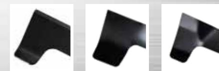
Standardní Vysokozdvížeňé Mulčovací