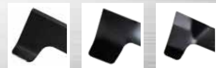
Standardní Vysokozdvížeň Mulčovací